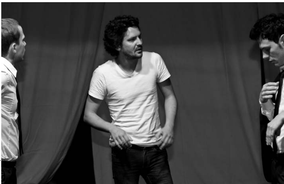
— || — fot. Maciej Żorawiecki