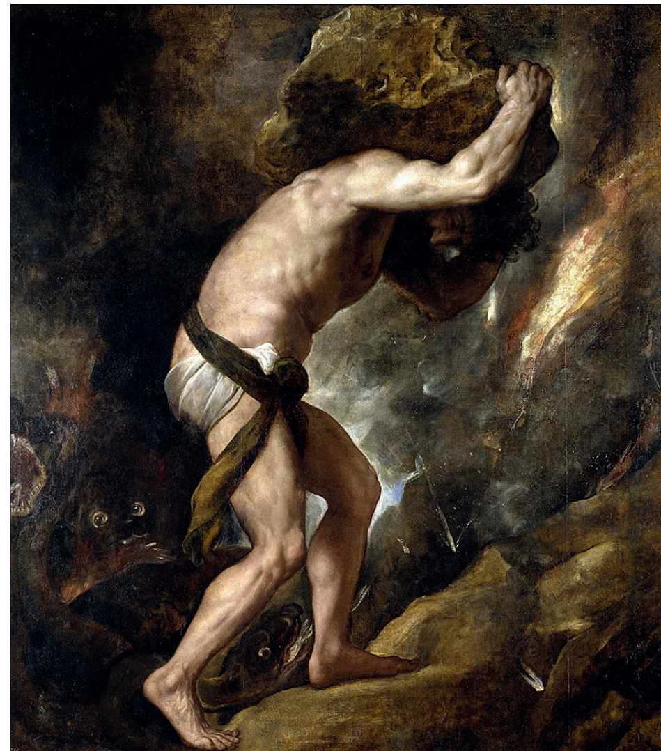
Tycjan, „Szyf”, 1548-1549, Muzeum Prado, Madryt, Hiszpania