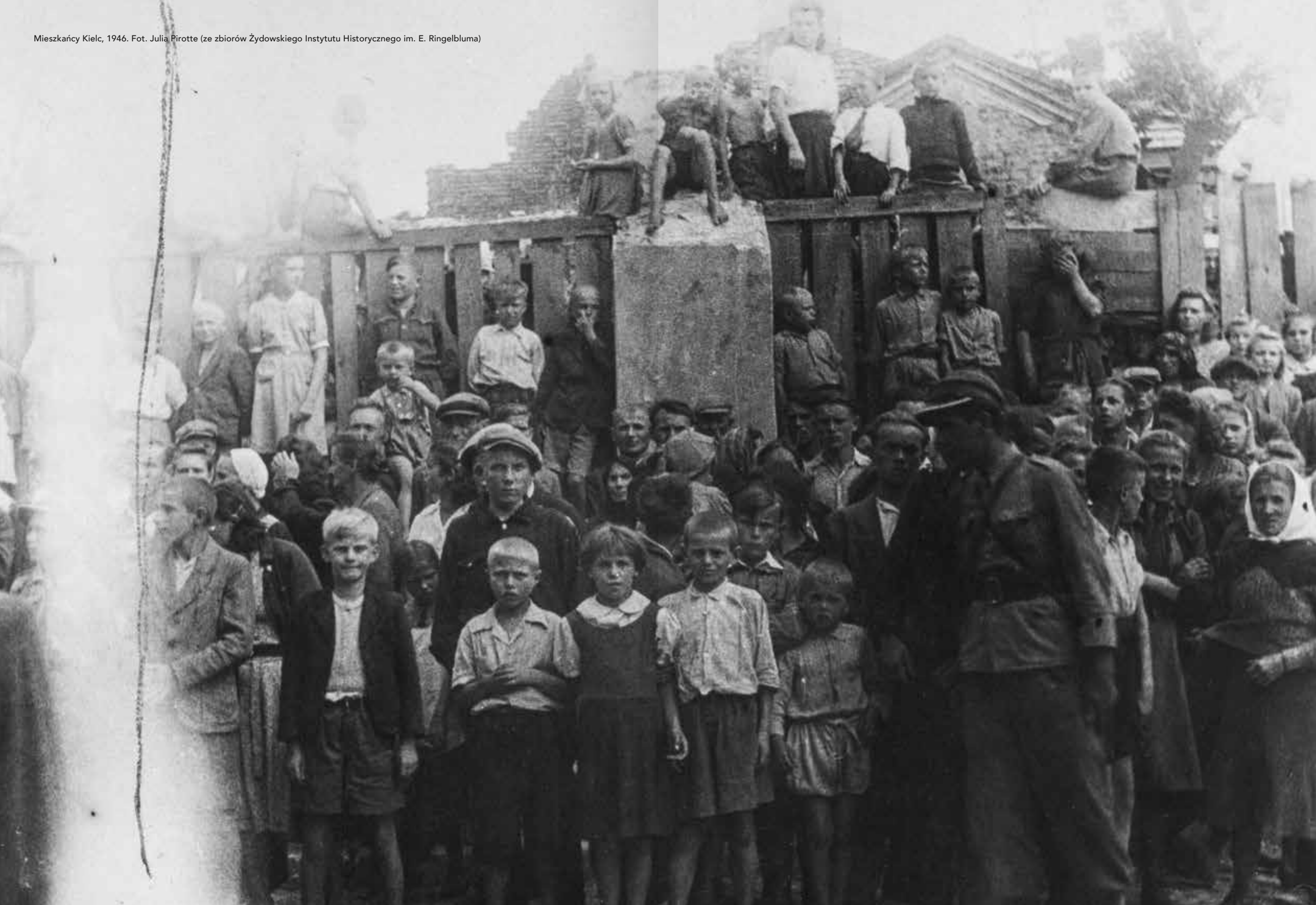
Mieszkańcy Kielc, 1946.