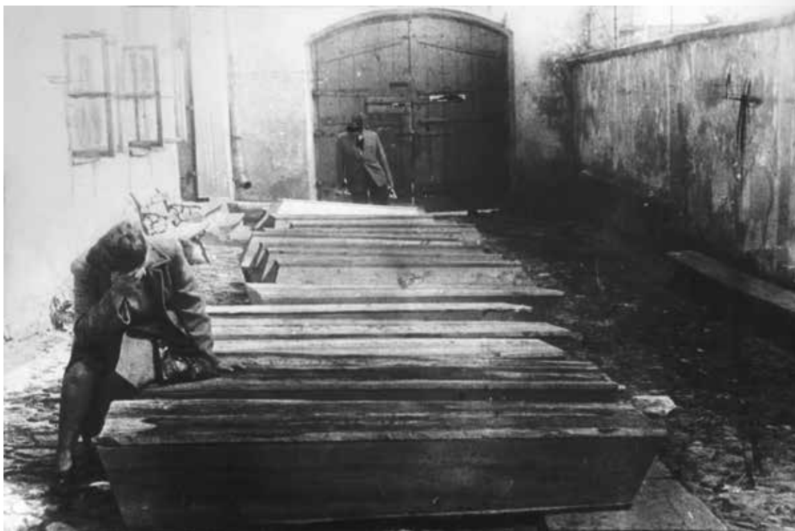
Trumny z ciałami ofiar pogromu kieleckiego przy Szpitalu św. Aleksandra, 1946.