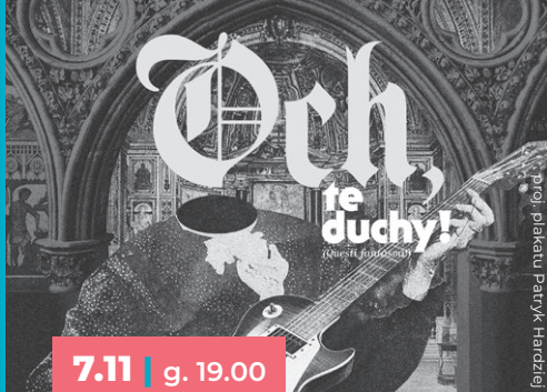
proj. plakatu Patryk Hardele