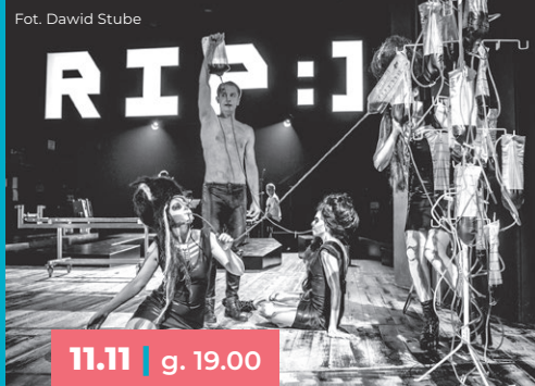
Fot. Dawid Stube